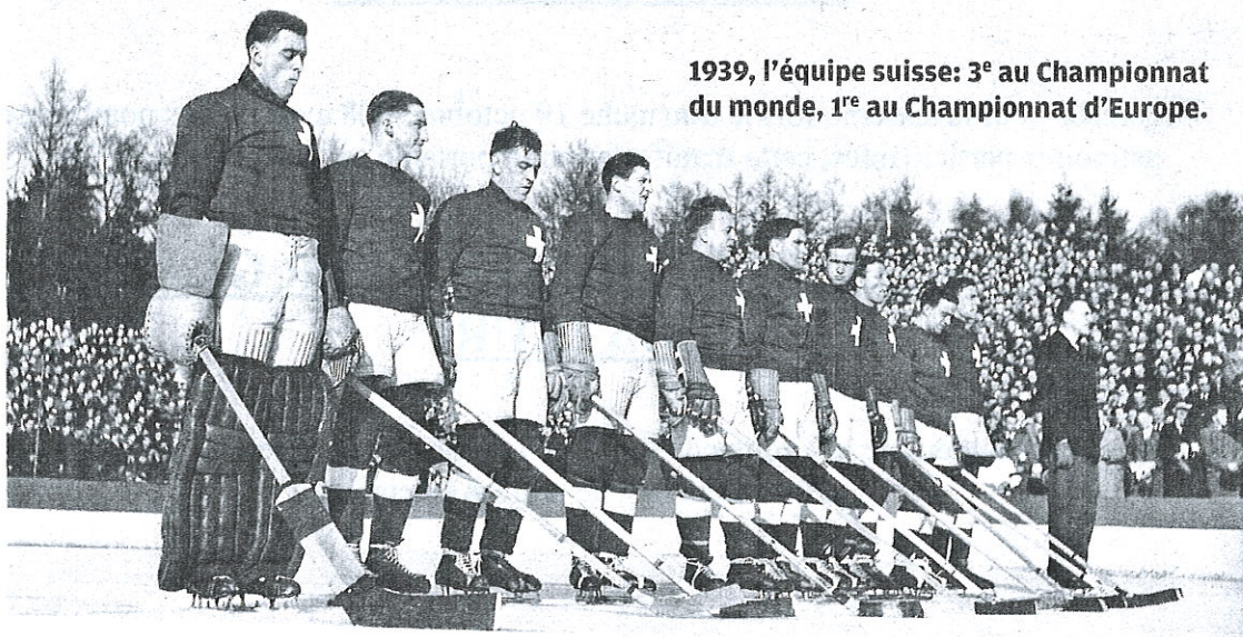
1939, l'équipe suisse: 3 e au Championnat du monde, 1 e e au Championnat d'Europe.