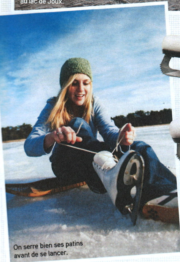
On serre bien ses patins avant de se lancer.

Famille, nature, thermos de thé: rien à voir avec l'ambiance drague des centres sportifs. On y va pour faire le plein d'oxygène, pas pour rencontrer l'âme sœur!