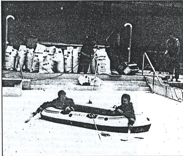
Les pompiers dans un canot pneumatique sur la piscine, un spectacle tout à fait inhabituel.

Ignorant tout d'abord l'huile qui arrivait et formait une