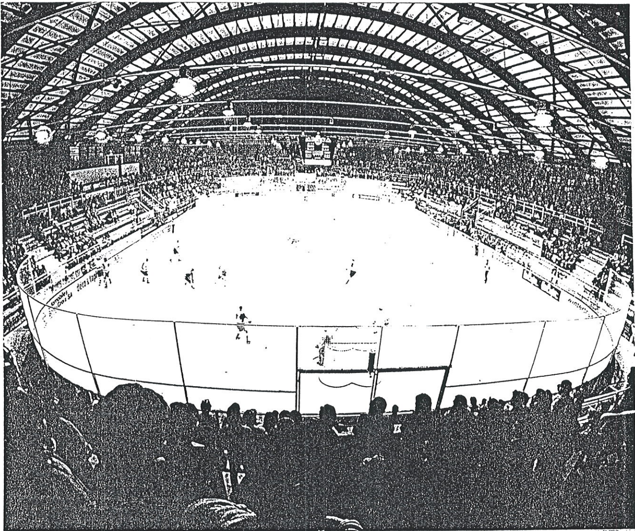
PRESENTATION DE LA PATINOIRE COMMUNALE DE FRIBOURG